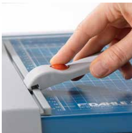
Regulowany ogranicznik tylny do szybkiego dopasowania formatu - może być mocowany na obu listwach