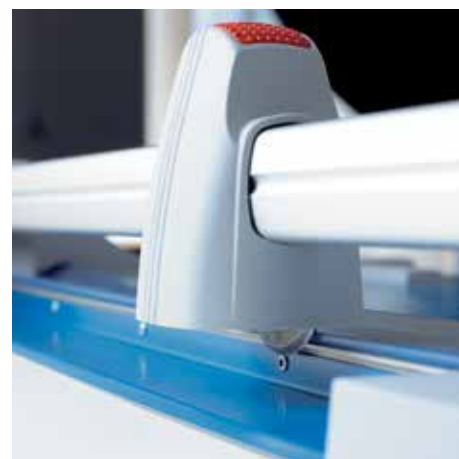
Ostrza krążkowe w plastikowej obudowie gwarantują maksymalne bezpieczeństwo